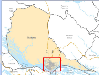
Localização da área urbana do Município de Manaus